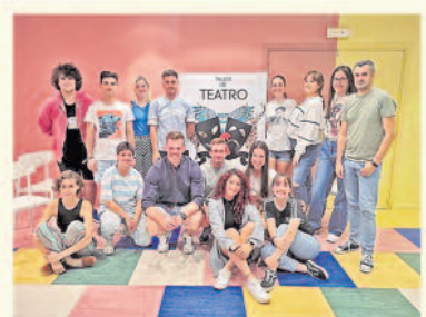
La JUVE acoge los nuevos cursos y talleres organizados por el FRAC