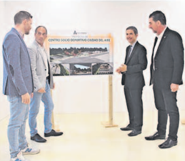
Presentado el proyecto del nuevo Centro Socio Deportivo para el barrio de Ciudad del Aire en Alcalá de Henares