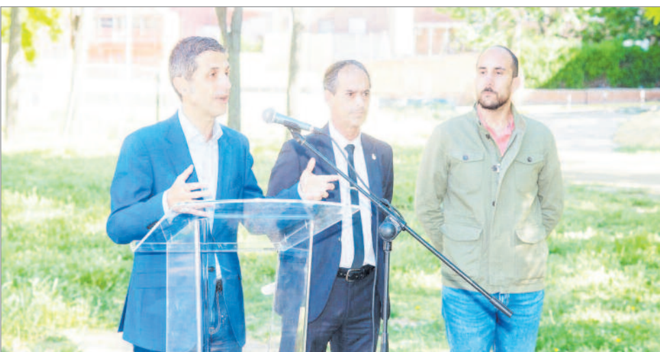
El Gobierno de Alcalá de Henares ha dedicado 7 millones de euros de inversión

peatonales, generar una plaza de encuentro, la creación de una nueva zona de juego para niños de 5 a 12 años, la renovación del alumbrado existente con luminarias más eficientes de tipo LED, y la instalación de nuevo mobiliario accesible que incluirá bancos, fuentes y papeleras. Además, se renovarán los juegos infantiles de la zona sur y la instalación de suelo de caucho en toda el área vallada, así será un parque infantil accesible en el barrio. Este parque cuenta con 178 ejemplares arbóreos inventariados y son una muestra del valor que el Ayuntamiento otorga a su arbolado. Además, entre la población arbórea del Demetrio Ducas se encuentran un madroño, un ciprés de Leyla, una robinia y un olmo;