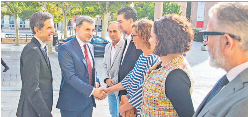
El embajador fue recibido por el alcalde y concejales del Ayuntamiento de Alcalá