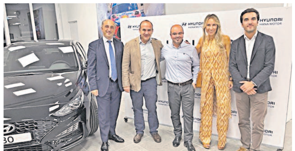
Miembros de AUTO RALLYE y de la firma HYUNDAI MOTOR ESPAÑA