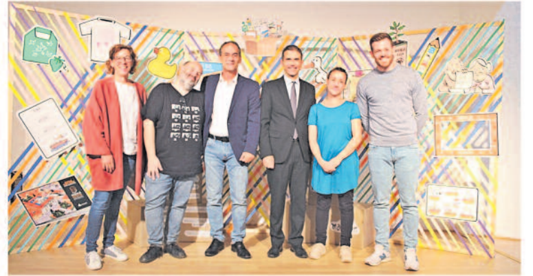
El Ayuntamiento de Alcalá de Henares obsequiará con un Pack Especial de Bienvenida a los bebés nacidos en 2021