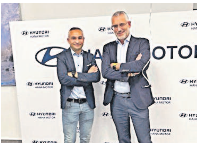
Miembros de la dirección de HYUNDAI MOTOR ESPAÑA