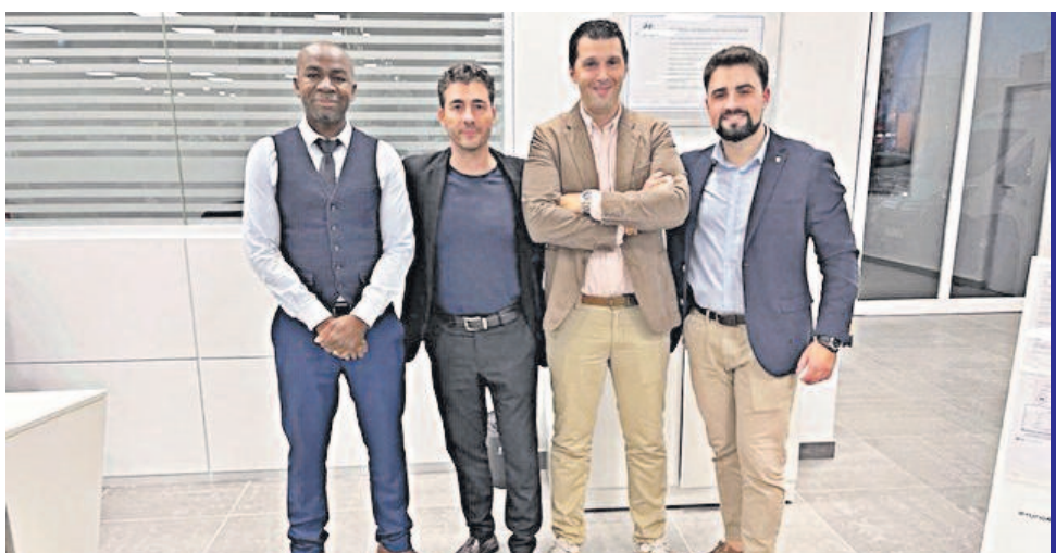
Parte del equipo de administración de AUTO RALLYE Alcalá de Henares

Grupo Auto Rallye - Vía Complutense 107 - Alcalá de Henares - 91 882 06 43