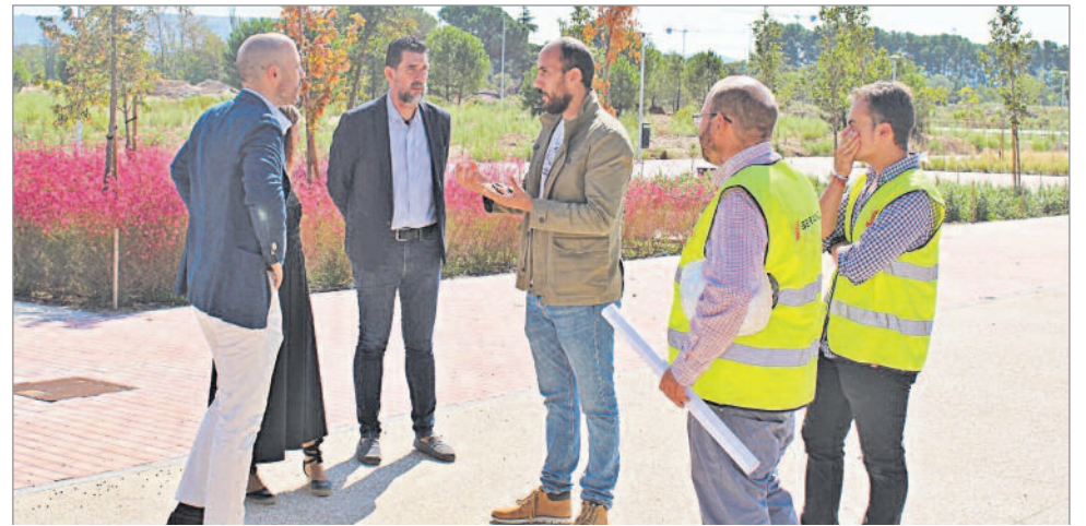
Las Sedas tendrá una gran extensión llena de nuevos espacios verdes

cuatro ejemplares catalogados como Árboles de Interés Local. Otro es la Plaza del Barro, un foro muy emblemático donde a través de una inversión de 500.000 euros, vamos a reformar, entre otros aspectos, la zona infantil y vamos a duplicar su capacidad. Y como no, el parque Tierno Galván, que antes era un descampado, y donde hemos hecho una inversión de 600.000 euros. Así que por fin, va a tener una vía iluminada y va a disfrutar de nuevas plantaciones, ya que es una zona de mucho flujo de mucho estudiantes que van al colegio, y de ocio donde, por ejemplo, se acude a jugar a la petanca. Pero hay otros parques emblemáticos como el de San Isidro, que con una inversión de 700.000 euros, buscamos que haya una zona infantil, una pequeña cancha y zona de juego deportivo para niños con áreas para juegos de pelota. Además en los barrios nuevos con familias jóvenes también queremos hacer zonas verdes, como es el caso del barrio de la Garena Sur, también vamos a crear una nueva zona estancial para que las familias jóvenes que empiezan sus vidas en ese nuevo barrio disfruten de zonas punteras desde el primer día. Otro barrio joven es la Plaza del Viento,