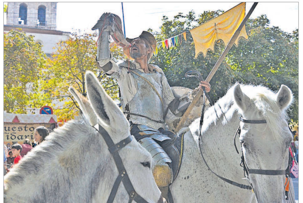
La Semana Cervantina se ha definido como una auténtica máquina del tiempo