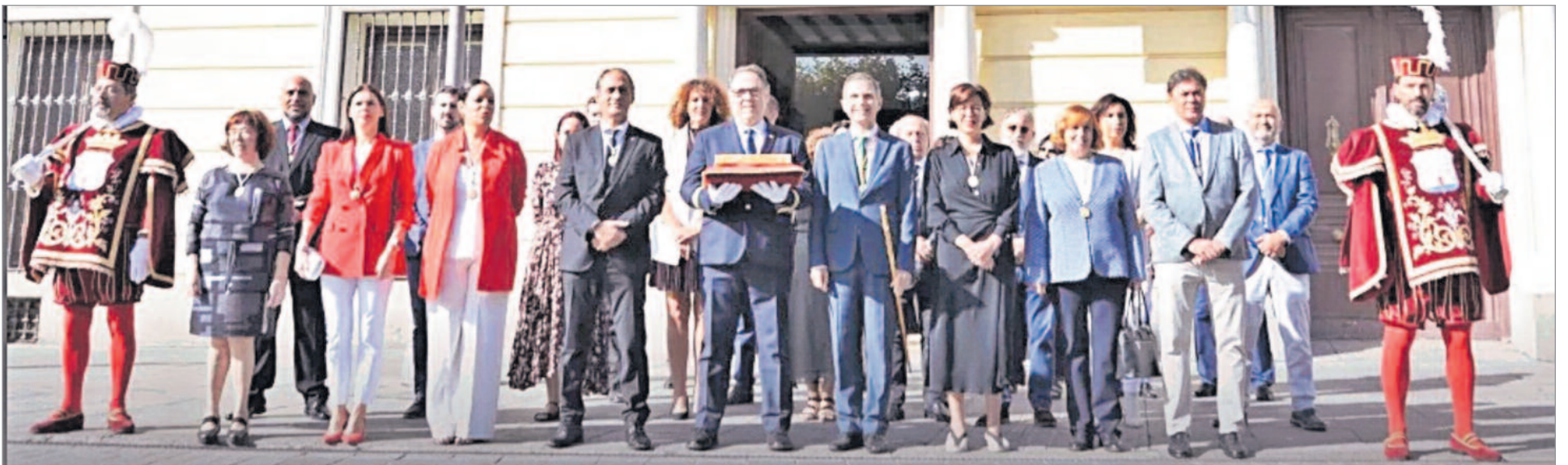
Alcalá de Henares celebró el 475 aniversario del bautismo de Miguel de Cervantes, la partida de bautismo de Miguel de Cervantes, quedó expuesta en la Capilla del Oidor