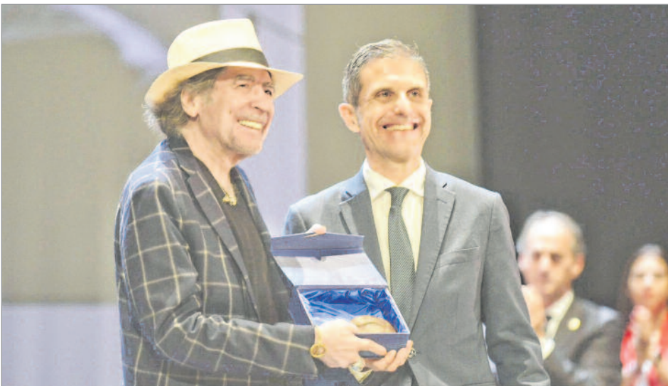
Joaquín Sabina recibió el Premio Ciudad de Alcalá a las Artes y las Letras

Como colofón a la Gala, recibió su Premio a las Artes y las Letras, Joaquín Sabina, “por ser un referente de la cultura popular iberoamericana, por la profundidad y sensibilidad de su poesía, por la cercanía sentimental y artística de su peculiar mundo musical y por haberse convertido en parte de la banda sonora de varias generaciones de españoles” . “Gracias Joaquín, nos has acompañado en nuestras vidas, nos has puesto banda sonora, desde tu Úbeda natal, también Ciudad Patrimonio de la Humanidad. Empezaste a escribir en el año 77 y hoy vivimos en una España mejor, tus letras han contado la historia de un país. Tu viaje vital, Joaquín, ha sido el que han hecho muchas personas para salir adelante buscando otros horizontes. Rompo una lanza a favor de que, si algún día el Premio Cervantes se lo dan a un cantante, se lo den a Joaquín Sabina”