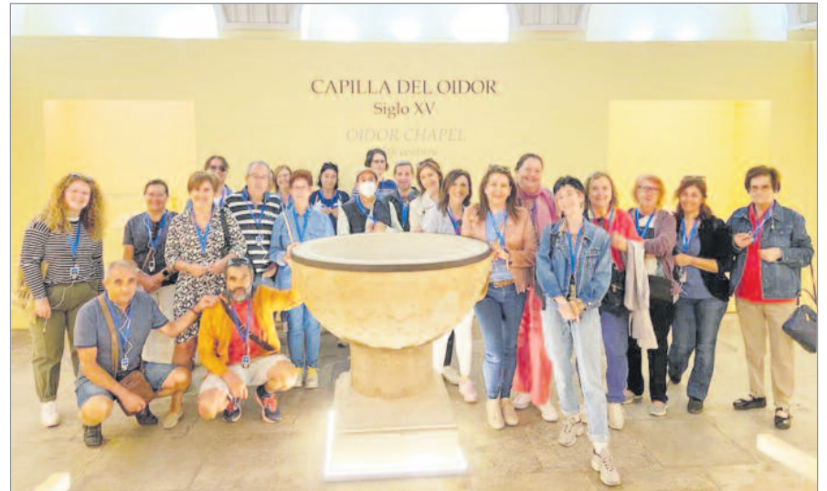
Una vez más, Alcalá de Henares innovó en el ámbito del turismo cultural.