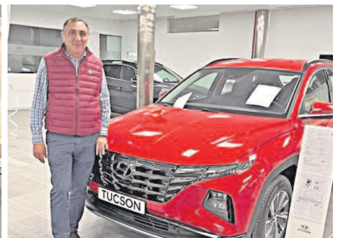
En la exposición estuvieron presentes todos los modelos de la firma