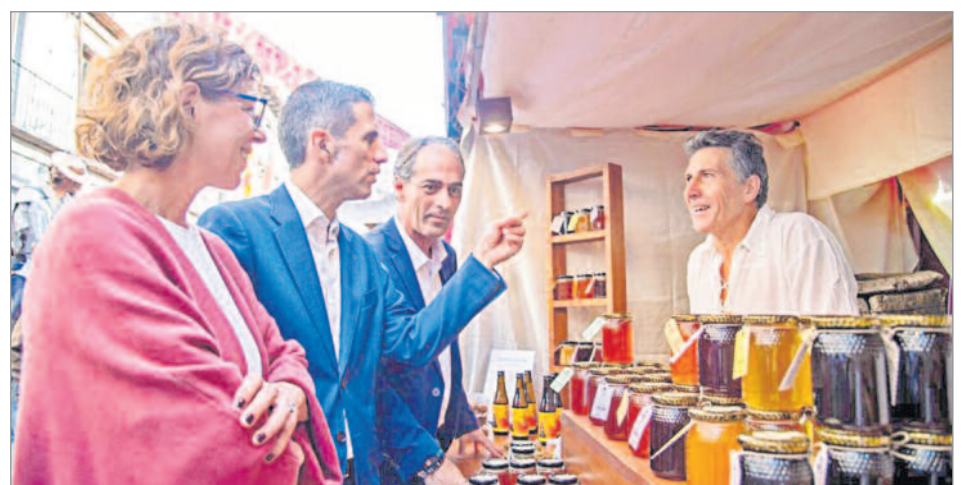
La excelente gastronomía local ofreció lo mejores productos kilómetro 0