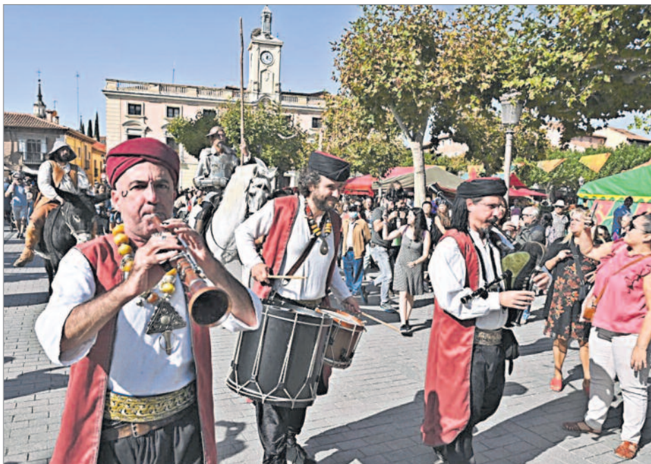
La música inundó la Ciudad Patrimonio de la Humanidad

En torno a esta efeméride la ciudad se engalanó y organizó el "Mercado Cervantino", que trasladó a vecinos y visitantes al Siglo de Oro, por la música, los olores tan característicos a incienso y manjares gastronómicos típicos de la época.