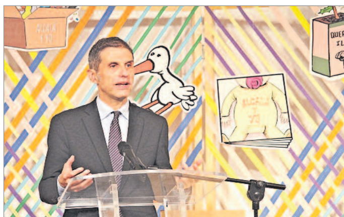
Javier Rodríguez Palacios, alcalde de Alcalá de Henares

El plazo de solicitud de los packs se extenderá hasta el 30 de octubre de 2022 y podrá llevarse a cabo: https://inscripciones.ayto-alcaladehenares.es/alcala-y-yo/