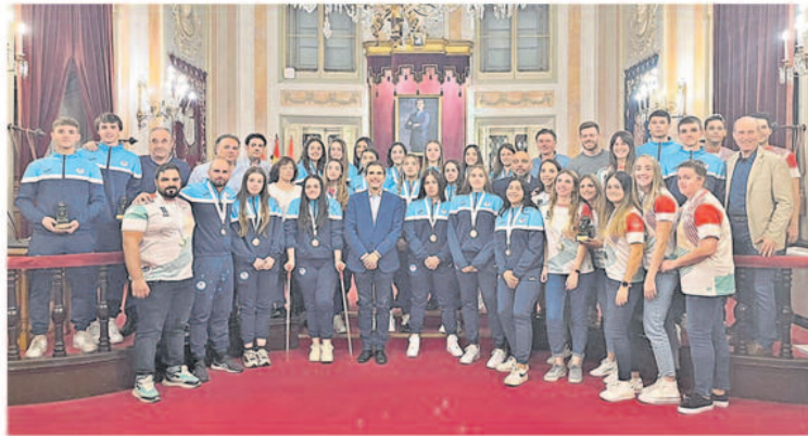
Deportistas del CD Iplacea y el Balonmano Playa Alcalá, recibidos en el Salón de Plenos del Ayuntamiento