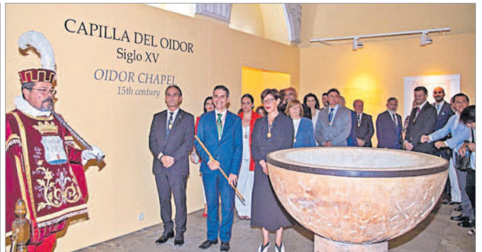
La procesión cívica trasladó la Partida de Bautismo de Miguel de Cervantes hasta la Capilla del Oidor que fue otro epicentro del 475 aniversario del bautismo de Miguel de Cervantes