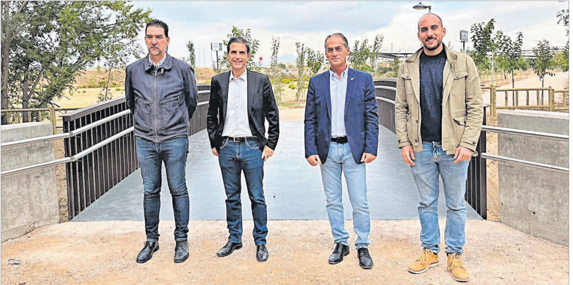
El alcalde, el vicealcalde, el segundo teniente de alcalde y concejal de Urbanismo, y el concejal de Medio Ambiente, visitaron la nueva pasarela sobre el arroyo Camarmilla

El proyecto ha contado con un presupuesto de licitación de 271.931,50 euros, cofinanciados en el marco del programa FEDER (Fondo Europeo de Desarrollo Regional)