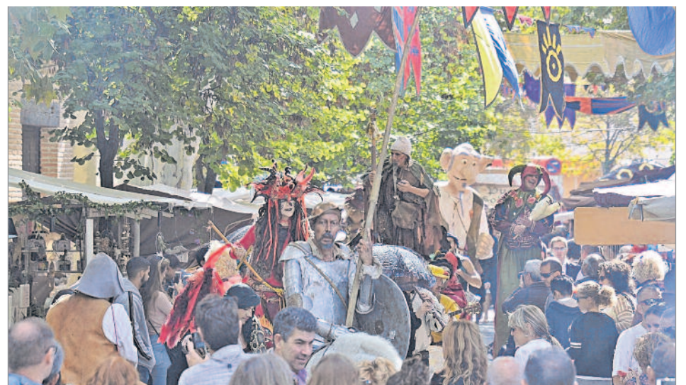
Este año el Mercado Cervantino acogió más de 250 puestos de artesanos y cerca de 600 actividades de calle en el casco histórico complutense.