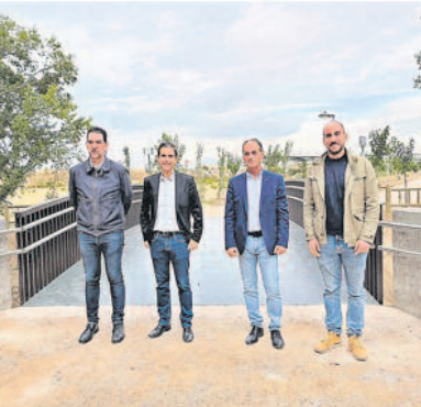
Inaugurada la nueva pasarela sobre el Arroyo Camarmilla