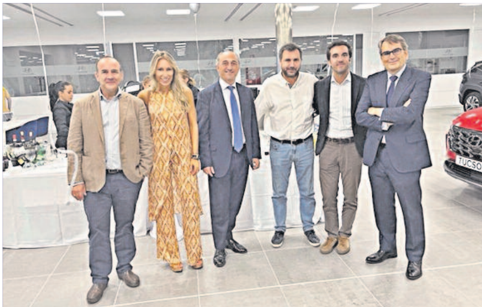
Alcalá de Henares se convirtió en el epicentro del motor del Corredor del Henares