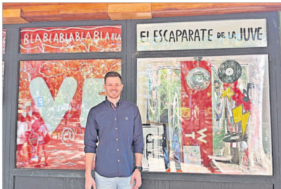
El Escaparate de la JUVE es otra de las acciones formativas que se organiza desde el FRAC

El Ayuntamiento de Alcalá de Henares puso en marcha los nuevos talleres de magia, teatro, cómic y dibujo digital, organizados por el Centro de Formación, Recursos y Actividades Juveniles (FRAC), dependiente de la Concejalía de Juventud, que tienen lugar en La JUVE. Asimismo, dentro de la programación formativa a disposición de la población joven de la ciudad, también comenzó el Curso de Monitores de Tiempo libre 2022-2023 en el que participan hasta el mes de abril un total de 28 jóvenes de 18 a 25 años. Esta formación es impartida por la Escuela de Tiempo Libre Henar. Por su parte, el Escaparate de la JUVE es otra de las acciones formativas que se organiza