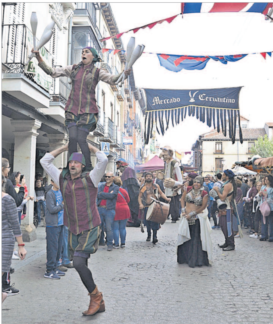
Las actuaciones y los espectáculos, incluso circenses, inundaron las calles