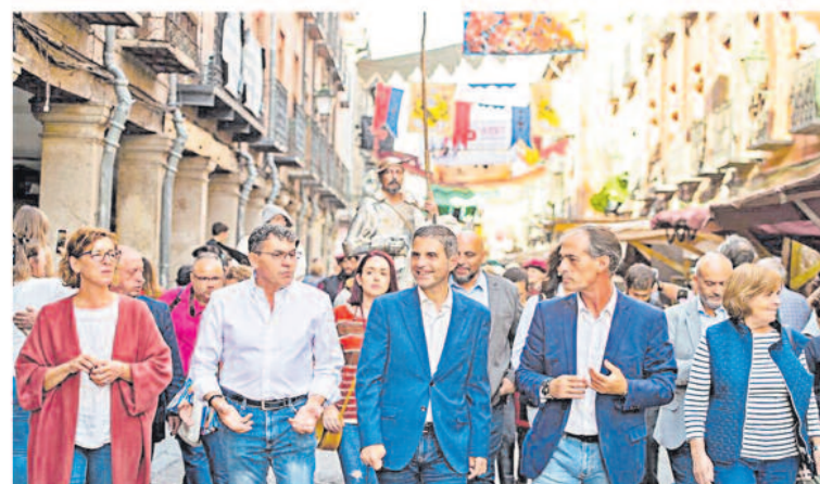
Alcalá de Henares acogió su Mercado Cervantino, el más importante de España