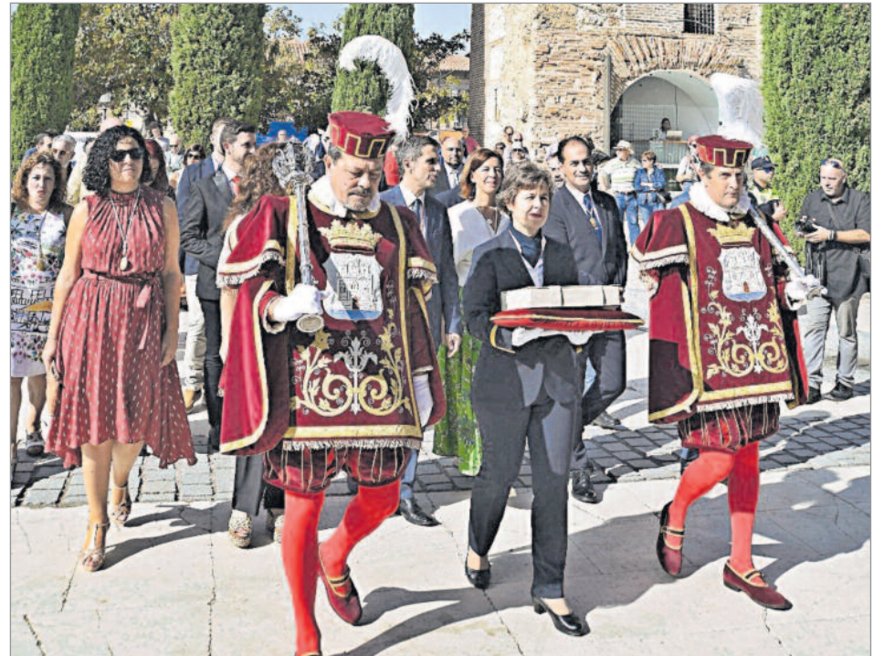
La ciudad complutense celebró su festividad local, que conmemora la fecha de bautismo de Miguel de Cervantes en Alcalá de Henares