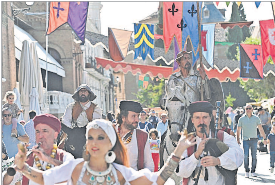
Alcalá de Henares se engalanó y organizó el "Mercado Cervantino"

Visitar Alcalá de Henares supuso vivir toda una experiencia. Además del atractivo de la ciudad en sí misma, Ciudad Patrimonio de la Humanidad y con una Universidad fundada en 1499, Alcalá esconde rincones patrimoniales de primer nivel, pero, además la ciudad vio nacer al más ilustre autor de las letras en Castellano, Miguel de Cervantes conmemoró el aniversario de ese nacimiento. Y su partida de bautismo