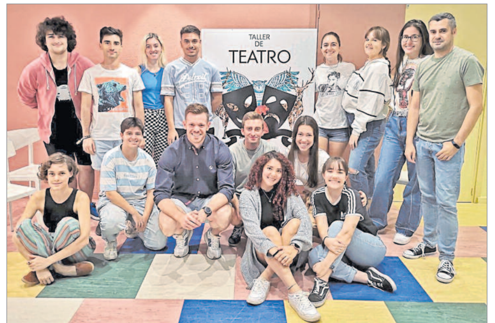
El Ayuntamiento puso en marcha los talleres de magia, teatro, cómic y dibujo digital

desde el FRAC, y enmarcado dentro del Taller de Arte Urbano. En esta ocasión, en colaboración con el Taller de Música de Alcalá, se ha optado por una imagen con tonos musicales que podrán visitar todas las personas interesadas en la Casa de la Juventud (JUVE) hasta el 28 de octubre. Además, una de las novedades de la nueva programación es el curso monográfico de Cómic infantil, para niños de 9 a 14 años, que se impartirá hasta el mes de diciembre. Y, por último, otro monográfico que se realizará del 16 al 18 de diciembre destinado a asociaciones juveniles y educadores denominado "La música en proyectos de animación y tiempo libre".