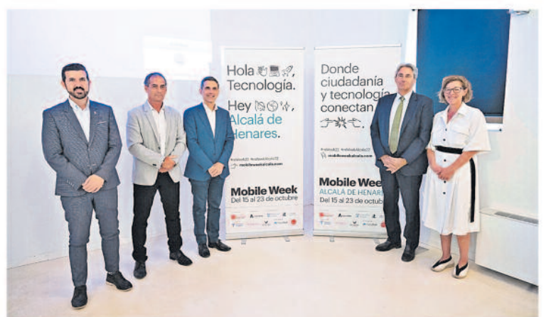
Alcalá de Henares acogerá de nuevo la Mobile Week del 15 al 23 de octubre con decenas de propuestas que llegarán a los barrios