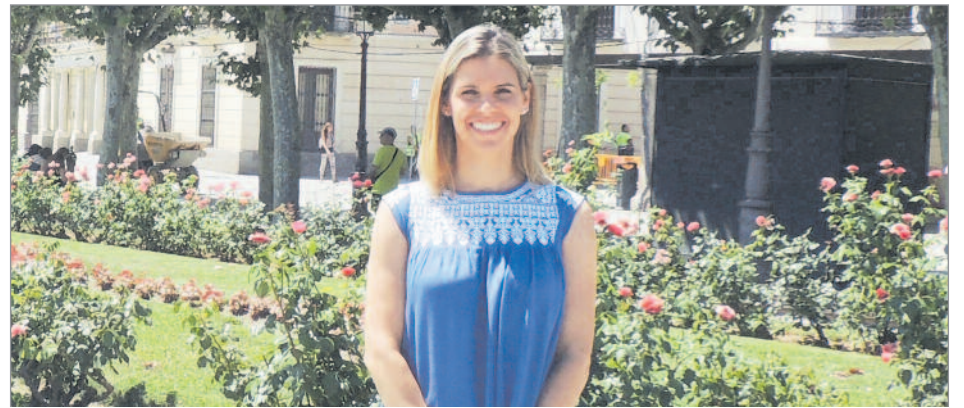
La portavoz municipal propuso un acceso directo con un paso subterráneo

“Lamentamos que el alcalde no haga autocrítica por no haber negociado bien este proyecto y por no ser capaz de exigir a Pedro Sánchez este acceso norte. Necesitamos un alcalde que se quite la camiseta que gobierne para todos. Esta reforma de la estación, en la que se va a invertir 15 millones de euros, es una oportunidad que no podemos perder si no incluye el acceso norte” , añadió Piquet, que recordó que esta propuesta se votó en el pleno y contó con el rechazo de PSOE y Ciudadanos. Esta misma petición planteada en Alcalá también la trasladó, en su condición de diputada en la Asamblea de Madrid, registrando una Proposición No