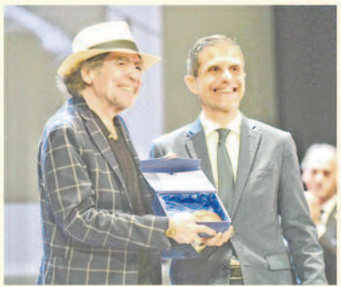
Joaquín Sabina recibió de manos del alcalde el Premio Ciudad de Alcalá a las Artes y las Letras