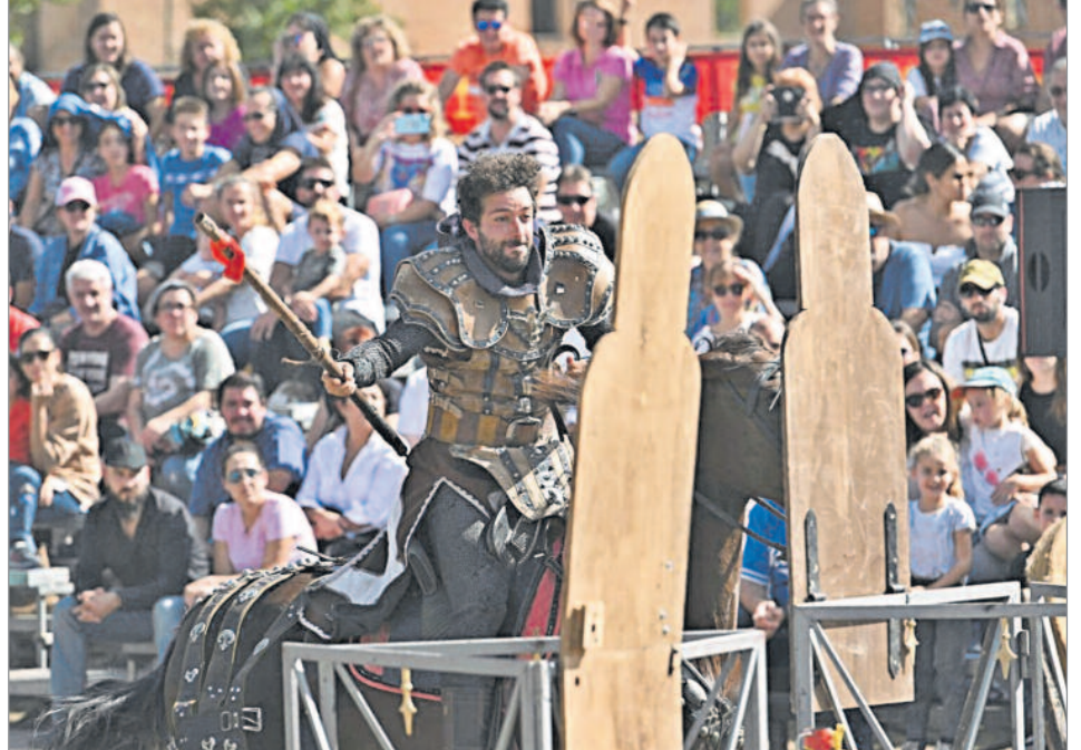
Alcalá de Henares ofreció una experiencia singular en un marco único