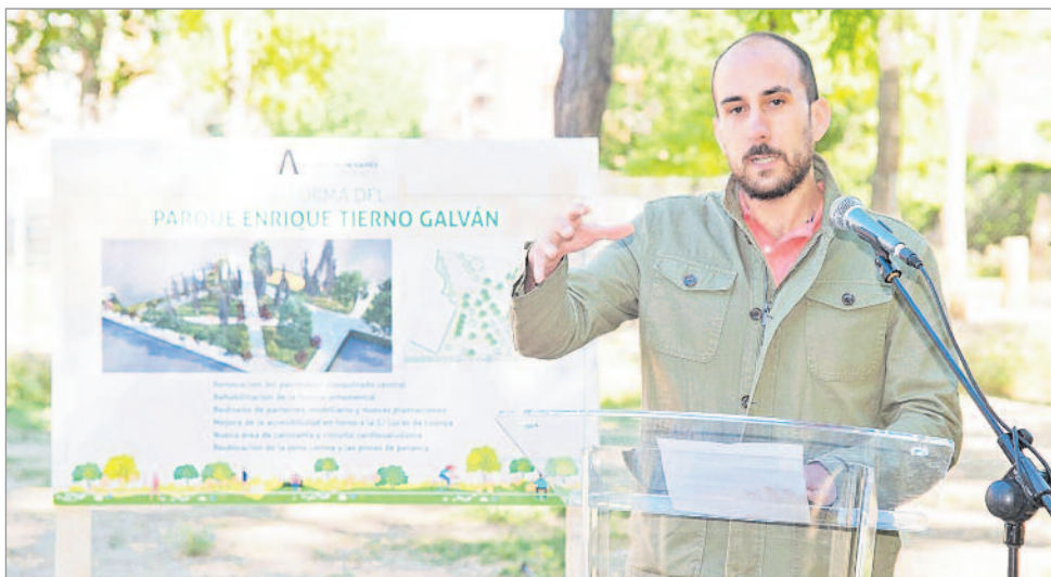
En el parque Tierno Galván el Ayuntamiento ha invertido 600.000 euros

E.N: Pues acabo de visitar el nuevo desarrollo urbanístico en el entorno de Las Sedas, que va a tener unas 5000 viviendas, y que está quedando muy bien. Ubicado entre el Olivar y Espartaes, el barrio tendrá una gran extensión llena de nuevos espacios verdes que complete el anillo urbano de Alcalá de Henares. Tendrá áreas de descanso, un espacio para perros y un parque de aventuras. Nuestro objetivo es que los vecinos de Las Sedas y El Olivar puedan disfrutar próximamente de un mejor entorno. Nuestra labor es estar