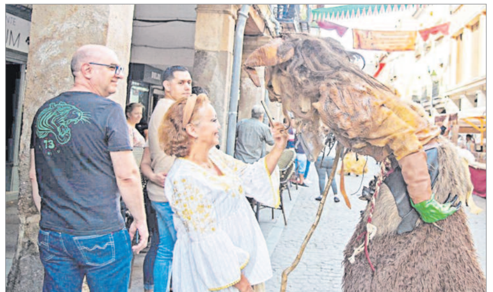
Alcalá de Henares es el Mercado más grande de Europa, lleno de magia e ilusión grande de Europa, Alcalá se convierte en magia e ilusión". Aranguren se mostró entusiasmada porque es "uno de los eventos que más visitantes concita y tenemos puesta toda la ilusión porque viajamos al siglo de Oro para recibir a todas las personas que quieran venir a conocernos"

acogió esta una nueva edición del Mercado Cervantino, que regresó al Casco Histórico para mostrar un espectacular despliegue técnico y humano, ya que acogió más de 250 puestos de artesanos y cerca de 600 actividades de calle con la actuación de 27 compañías de teatro. La Semana Cervantina fue declarada Fiesta de Interés Turístico Nacional en 2018 y la edición de 2022 apostó por afianzarse como el Mercado más relevante de España, gracias a la masiva participación de alcalaínos y visitantes. Y es que, el Mercado Cervantino de Alcalá de Henares, se ha configurado como uno de los grandes eventos de la Ciudad de Cervantes. Se ha definido como una auténtica máquina del tiempo que transporta a los visitantes al Siglo de Oro y que es capaz de congregar cada año a miles de personas. El alcalde destacó que "por fin" regresó el Mercado Cervantino en su Semana Cervantina, "con un fin de semana repleto de personas de la Comunidad de Madrid y que nos convierte en polo de atracción turística, el lunes y el martes serán los días de los vecinos y vecinas de Alcalá de Henares, y esperamos batir récords de asistencia y retomemos este Mercado sobre todo para los más pequeños en una ciudad con identidad propia" , concluyó. El vicealcalde, por su parte, afirmó que venir estos días a Alcalá "es un lujo porque es el Mercado más