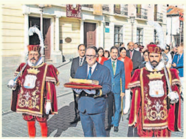
Alcalá de Henares celebró el 475 aniversario del bautismo de Miguel de Cervantes en la ciudad