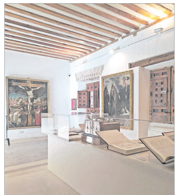
La Concejala de Turismo invitó a los vecinos de Alcalá a inscribirse en estas visitas gratuitas

https://inscripciones.aytoalcaladehenares.es/#inscripciones Para más información sobre las visitas, el personal de las oficinas de turismo de la ciudad estará a disposición de los interesados en los teléfonos: 918892694 y 918810634.